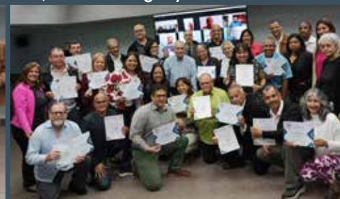
Reconocimientos a Auditores