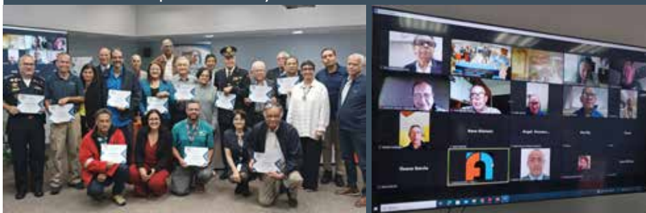
Normalizadores en acto presencial y vía telemática