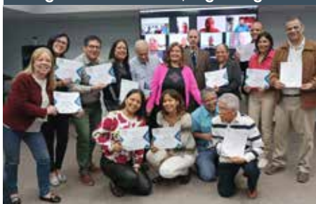
Reconocimientos a Facilitadores